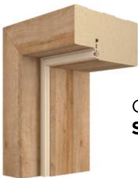
OŚCIEŻNICA STAŁA MDF