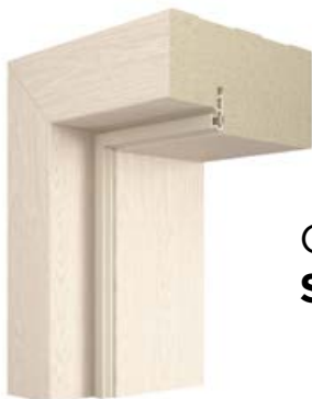
OŚCIEŻNICA STAŁA MDF