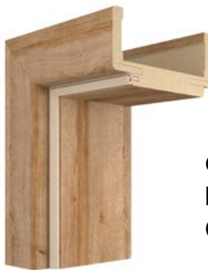
OŚCIEŻNICA REGULOWANA DIN (OPASKA 80 mm)

Opaska standardowa jest produkowana z MDF o stałej szerokości 80 mm. Kompletna opaska składa się z trzech elementów: dwóch pionowych i jednego poziomego.