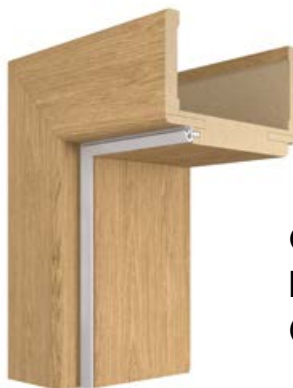
OŚCIEŻNICA REGULOWANA DIN (OPASKA 80 mm)