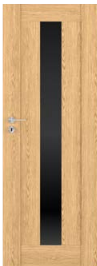
MILANO szer. 70, Dąb Miodowy