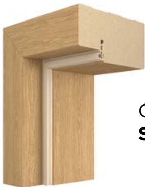
OŚCIEŻNICA STAŁA MDF