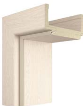
OŚCIEŻNICA REGULOWANA DIN (OPASKA 80 mm)

Opaska standardowa jest produkowana z MDF o stałej szerokości 80 mm. Kompletna opaska składa się z trzech elementów: dwóch pionowych i jednego poziomego.