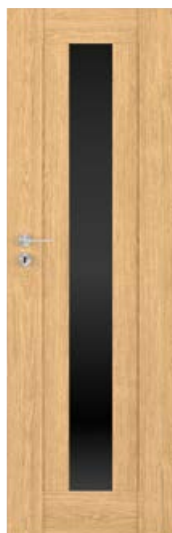
MILANO szer. 60, Dąb Miodowy

Dąb Miodowy kolor z grupy CLPL, fornir syntetyczny