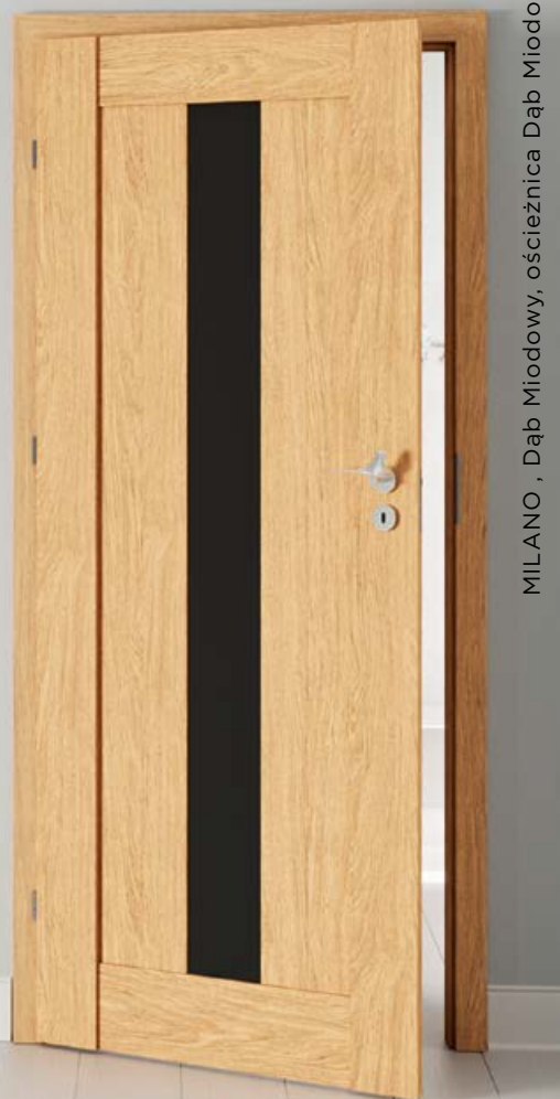
MILANO , Dąb Miodowy, ościeżnica Dąb Miodowy