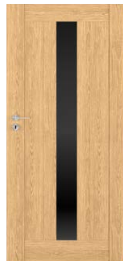
MILANO szer. 90, Dąb Miodowy