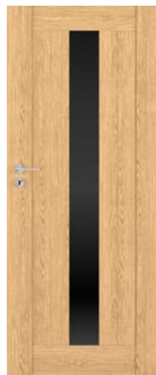
MILANO szer. 80, Dąb Miodowy