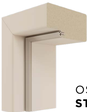
OŚCIEŻNICA STAŁA MDF