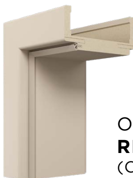
OŚCIEŻNICA REGULOWANA DIN (OPASKA 80 mm)

Ćwierćwałek jest produkowany z MDF o stałej szerokości 18 mm. Kompletny ćwierćwałek składa się z trzech elementów: dwóch pionowych i jednego poziomego.