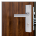
zamek dolny 3-ryglowy (Typ A, Typ P)