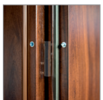
bolce antywyciągnięte (Typ P)