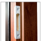
zaczep zamka górnego (Typ P)