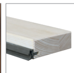
próg drewniany surowy w cenie kompletu