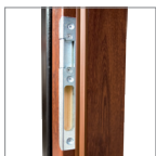
regulowany zaczep zamka