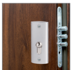
zamek górny 3-ryglowy (Typ P)