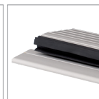
lub za dopłatą próg aluminiowy