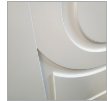
profil ramiaka skrzydła