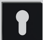
Szyld na klucz 35,00/43,05