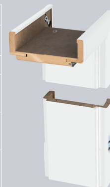
ościeżnica SW regulowana