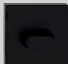
Szyld WC 47,00/57,81